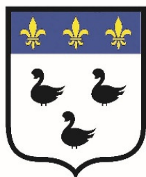
Ville de LAON